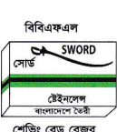
বিবিএফএল সোড ইইনসোল বাংলাদেশ ২২৫ শেভিং ব্লক রেজর