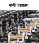
গাজী ওয়ারহাউস তামার তার (এসইসি, এপি, এইচ ভিবিসি)