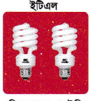
ইটিএল সিএফএল, এলইডি ও টিউব লাইট

প্রধান ব্যক্তিপ্রশাসন কর্মকর্তা (ভারপ্রাপ্ত)