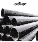
এনটিএল এসআই, জিআই, এমএস পাইপ