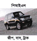
পিআইএল জীপ, বাস, ট্রাক