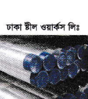
ঢাকা স্টীল ওয়ার্কস লিঃ এম এস রড ও বার সামগ্রী