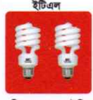
ইটিএল সিএফএল, এলইডি ও টিউব লাইট