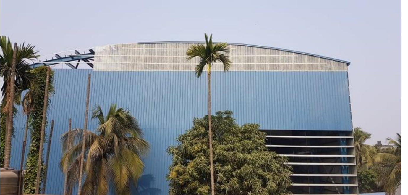
প্রকল্পের আওতায় নির্মানাধীন নতুন ফ্যাক্টরী ভবন

বিএসইসি'র নিয়ন্ত্রণাধীন শিল্প প্রতিষ্ঠান আধুনিকায়নের নিমিত্ত “গাজী ওয়ারস্ লিঃ-কে শক্তিশালী ও আধুনিকীকরণ” প্রকল্প” প্রকল্প গ্রহণ করা হয়েছে। প্রকল্পের বাস্তব ও আর্থিক অগ্রগতি যথাক্রমে ৯৫% ও ৯৪.৩১% । প্রকল্পটির বাস্তবায়ন মেয়াদ ডিসেম্বর’২০২১।