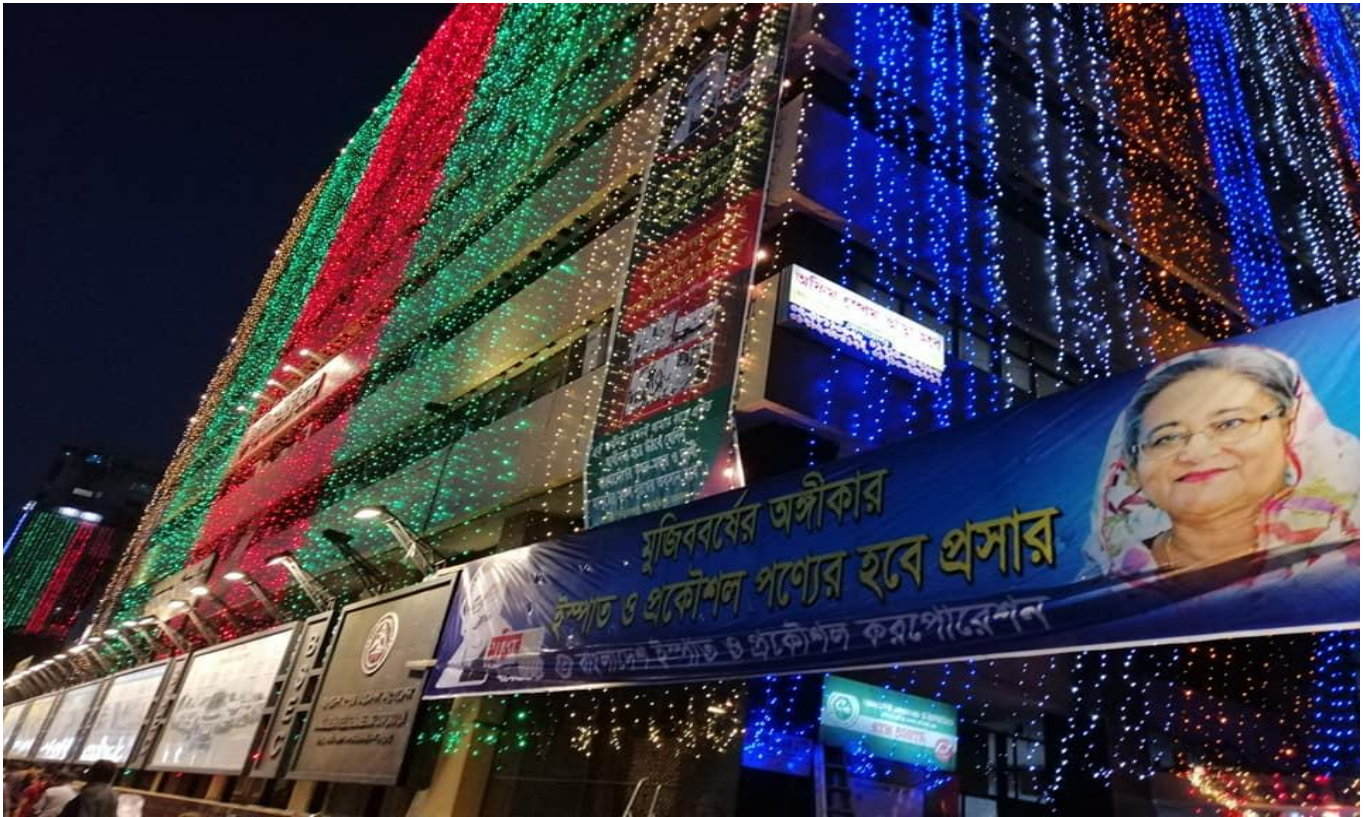
মুজিব বর্ষ উপলক্ষে বিএসইসি ভবন আলোকসজ্জিতকরণ

জাতীয় কর্মসূচি ও মন্ত্রণালয়ের সাথে সামঞ্জস্য রেখে বিএসইসি কর্তৃক বিভিন্ন কর্মসূচি গ্রহণ ও বাস্তবায়ন করা হচ্ছে।