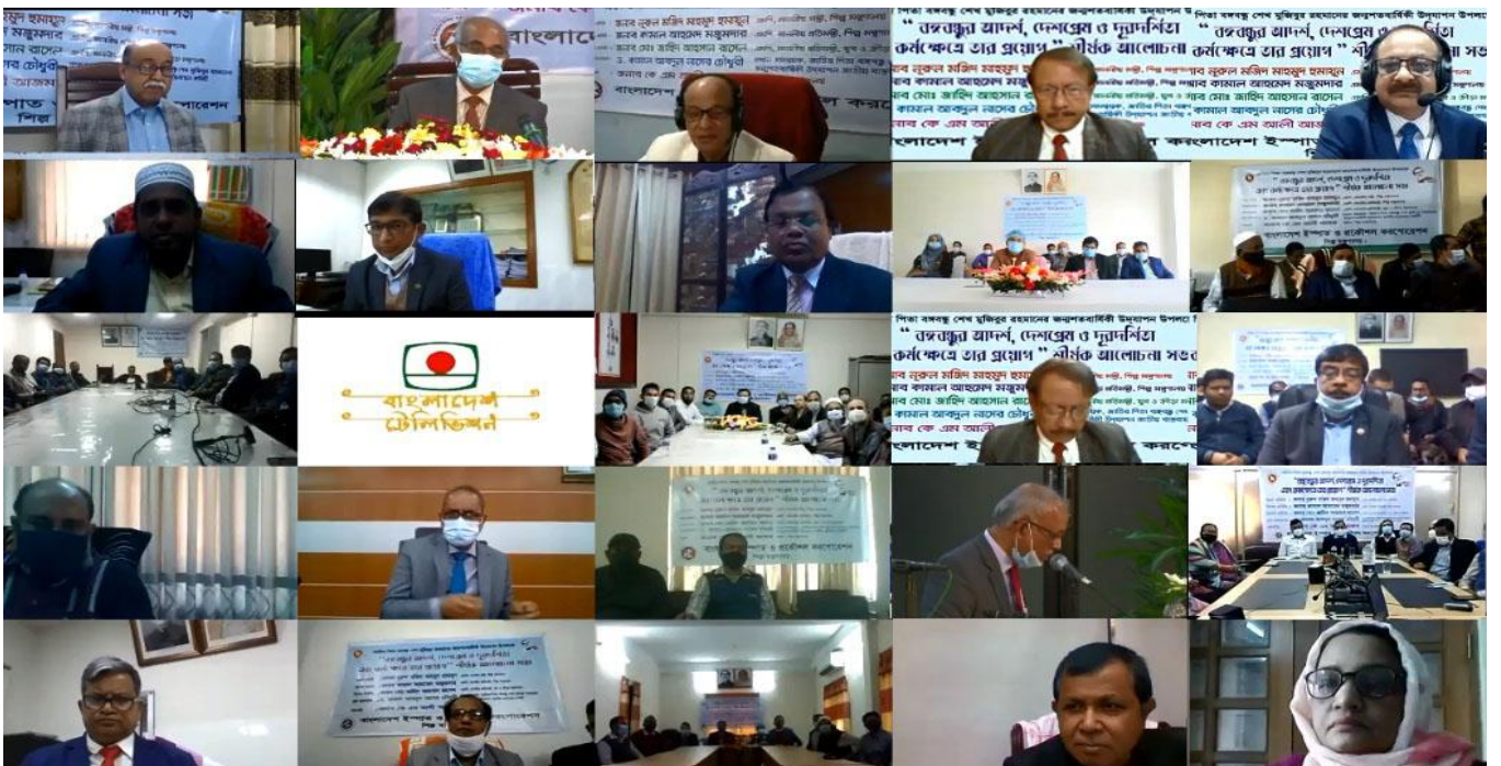
“বঙ্গবন্ধুর আদর্শ, দেশপ্রেম ও দূরদর্শিতা কর্মক্ষেত্রে প্রয়োগ” শীর্ষক আলোচনা সভা (ভার্চুয়াল পদ্ধতিতে আয়োজিত)

উল্লেখযোগ্য কর্মসূচিসমূহ- ১) ১৭ মার্চ ২০২১ তারিখে সূর্যোদয়ের সাথে সাথে বিএসইসি ভবনে জাতীয় পতাকা উত্তোলন করা হয়েছে। ২) ১৭ মার্চ ২০২১ তারিখে শিল্প মন্ত্রণালয়ে নির্মিত বঙ্গবন্ধুর প্রতিকৃতিতে চেয়ারম্যান মহোদয়ের নেতৃত্বে ১০ জন কর্মকর্তা ও ৫ জন কর্মচারির সমন্বয়ে নির্ধারিত সময়ে শ্রদ্ধা জ্ঞাপন করা হয়েছে, ঠিক একই ভাবে ঐ দিন বিএসইসি'তেও বঙ্গবন্ধু শেখ মুজিবুর রহমানের প্রতিকৃতিতে শ্রদ্ধা জ্ঞাপন করা হয়েছে। ৩) ১৭ মার্চ ২০২১ তারিখে বিএসইসি ভবনে বঙ্গবন্ধুর প্রতিকৃতিতে পুষ্পস্তবক অর্পণের সময় সাইন্ড বক্সের মাধ্যমে থিম সং প্রচার করা হয়েছে। ৪) ১৭ মার্চ ২০২১ তারিখ হতে বিএসইসি ভবন আলোকসজ্জা করা হয়েছে, যা ২৭ মার্চ ২০২১ পর্যন্ত ছিল। (২৫ মার্চ ২০২১ তারিখে আলোকসজ্জা বন্ধ ছিল)।