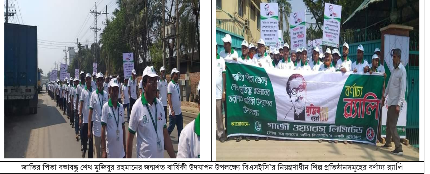
জাতির পিতা বঙ্গবন্ধু শেখ মুজিবুর রহমানের জন্মশত বার্ষিকী উদযাপন উপলক্ষ্যে বিএসইসি'র নিয়ন্ত্রণাধীন শিল্প প্রতিষ্ঠানসমূহের বর্ণাঢ্য র্যালি

১১) জাতির পিতা বঙ্গবন্ধু শেখ মুজিবুর রহমান এর জন্মশত বার্ষিকী উপলক্ষে গৃহহীন পরিবারকে ৫টি গৃহ বাবদ (৩,২৫০০০×৫)=১৬,২৫,০০০/- (ষোল লক্ষ পঁচিশ হাজার) টাকা শিল্প মন্ত্রণালয়ে প্রেরণ করা হয়েছে। মাননীয় শিল্পমন্ত্রী, মাননীয় শিল্প প্রতিমন্ত্রী, শিল্প সচিব মহোদয় ও চেয়ারম্যান, বিএসইসি এবং শিল্প মন্ত্রণালয়ের আওতাধীন অন্যান্য দপ্তর/ সংস্থার কর্মকর্তাগণের উপস্থিতিতে ১০-০৬-২০২১ তারিখে মাননীয় প্রধানমন্ত্রীর নিকট ৮৫,৫০,০০০/- (পঁচাশি লক্ষ পঞ্চাশ হাজার) টাকার চেক হস্তান্তর করা হয়েছে। এছাড়াও মাননীয় প্রধানমন্ত্রীর নির্দেশনা মোতাবেক সংস্থা প্রধান কর্তৃক ১টি গৃহ প্রদানের উদ্যোগ নেয়া হয়েছে।