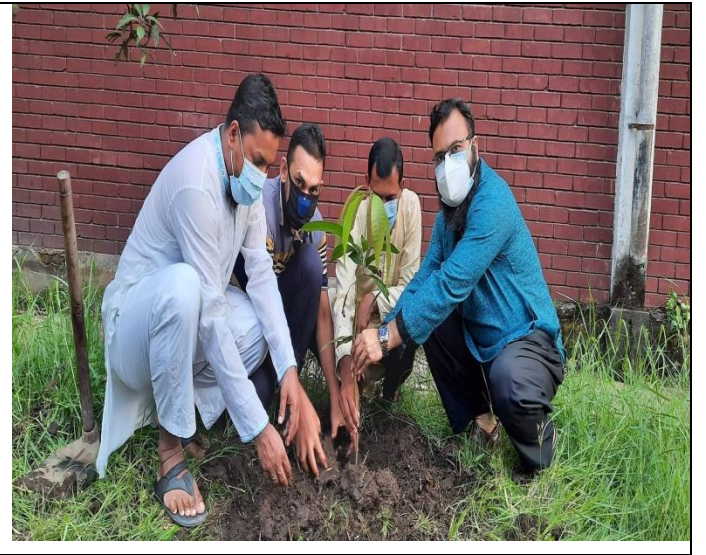
বৃক্ষরোপন কর্মসূচি শুরুকরণ