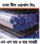
ঢাকা ষ্টীল ওয়ার্কস লিঃ