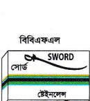
বিবিএফএল শেভিং রেড রেজর