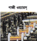
গাজী ওয়্যারস তামার তার (এসইসি, এপি, এইচ ডিবিবি)