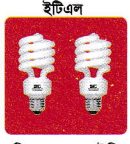
ইটিএল সিএফএল, এলইডি ও টিউব লাইট