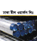
ঢাকা স্টীল ওয়ার্কস পিঃ এম এল রড ও বার সামগ্রী