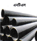
এপিএল এপিআই, জিআই, এমএস পাইপ