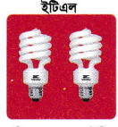
ইটিএল সিএফএল, এলইডি ও টিউব লাইট