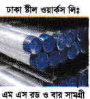
ঢাকা স্টিল ওয়ার্কস লিঃ